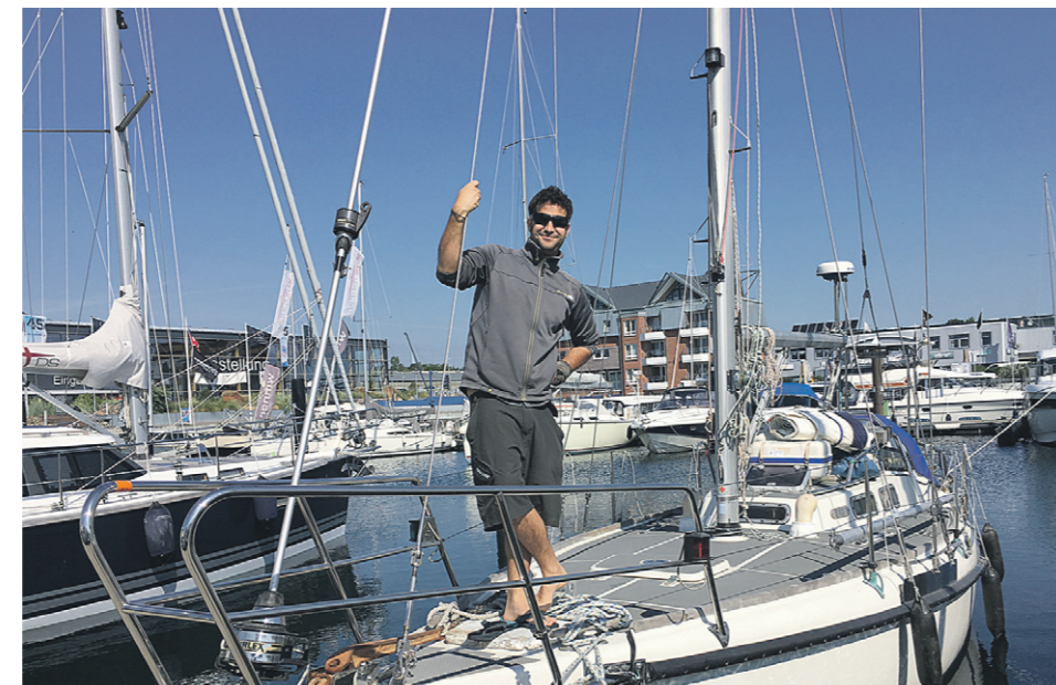
Während der zwei Jahre auf See soll mit Harpunen gefischt werden, um den Speiseplan aufzupeppen.