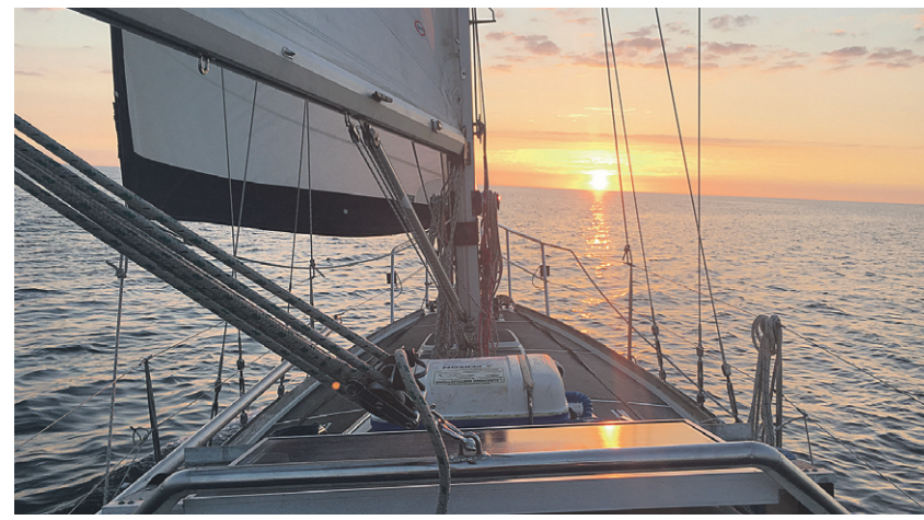
Ausblicke wie diesen Sonnenaufgang auf dem Bodensee werden die beiden während der zweijährigen Weltumsegelung wohl viele haben.