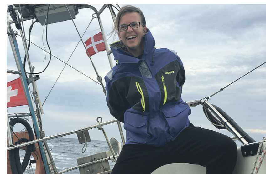
Während der ganzen zwei Jahre soll 24 Stunden am Tag gefilmt werden, um daraus einen Dokumentarfilm zu produzieren.